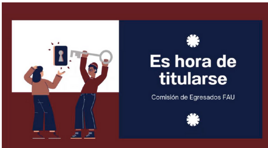
Videos informativos sobre titulación