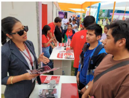
Campañas de difusión