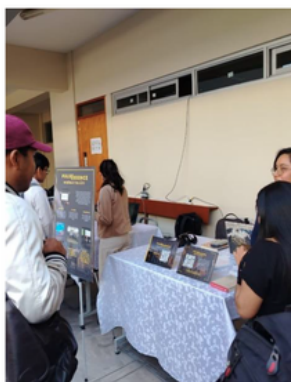
Feria de emprendimiento de Egresados